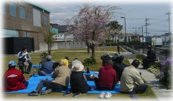
晴天のお花見の様子