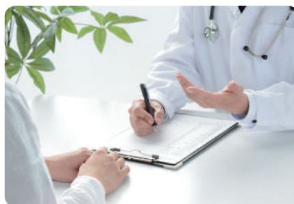
短期間で検査結果を報告