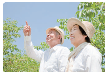
結果をもとに「よりよい生活」のご提案